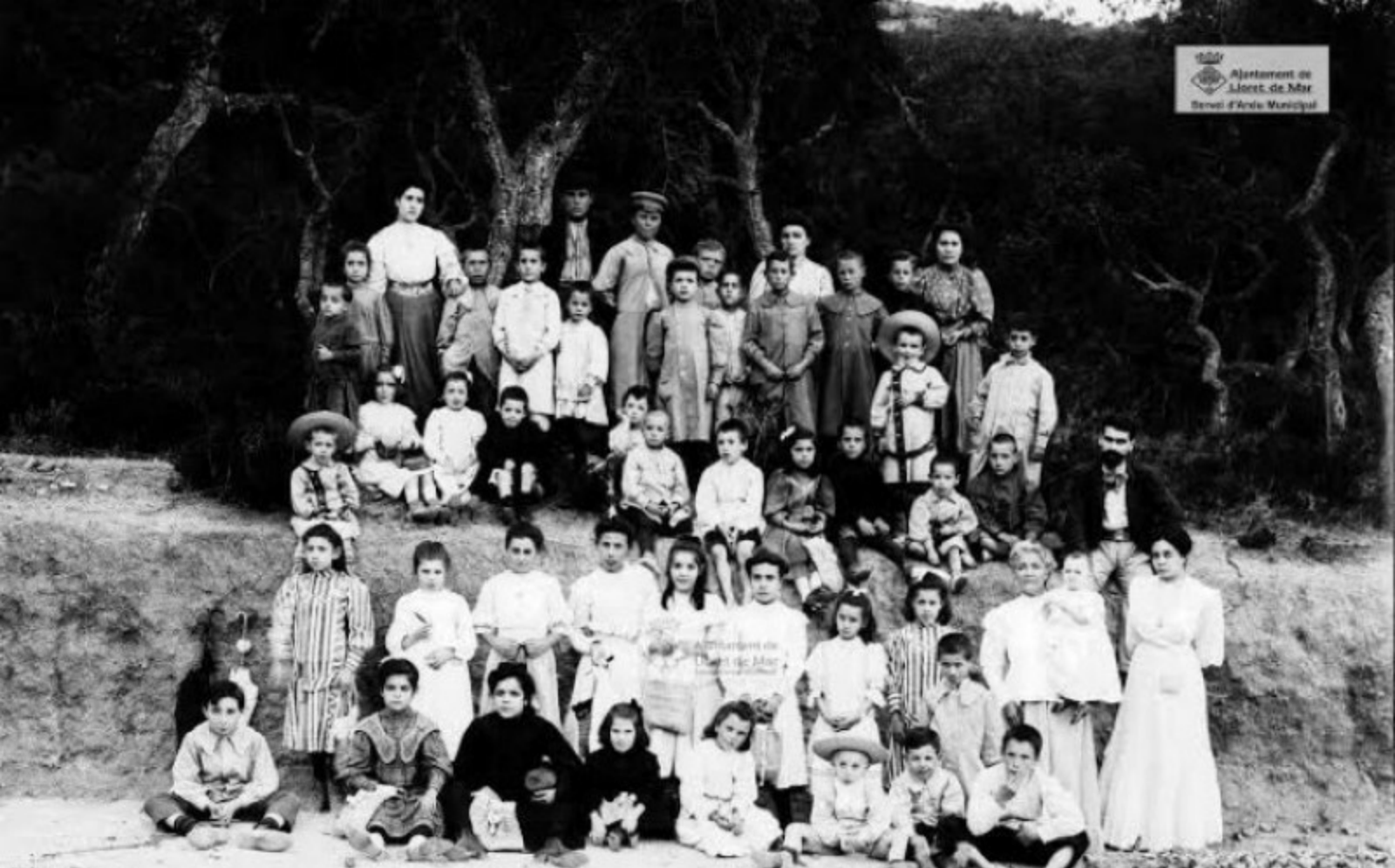
ESCUOLA HORACIANA de LLORET DE MAR PASSEU ESCOLAR 26.8.08