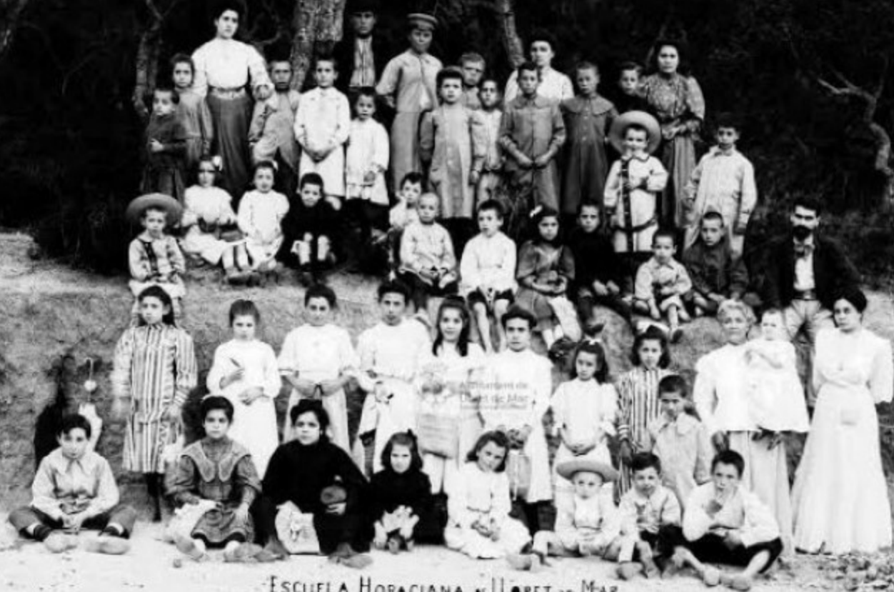
ESCUELA HORACIANA DE LLORET DE MAR PASO ESCOLAR 26.8.08